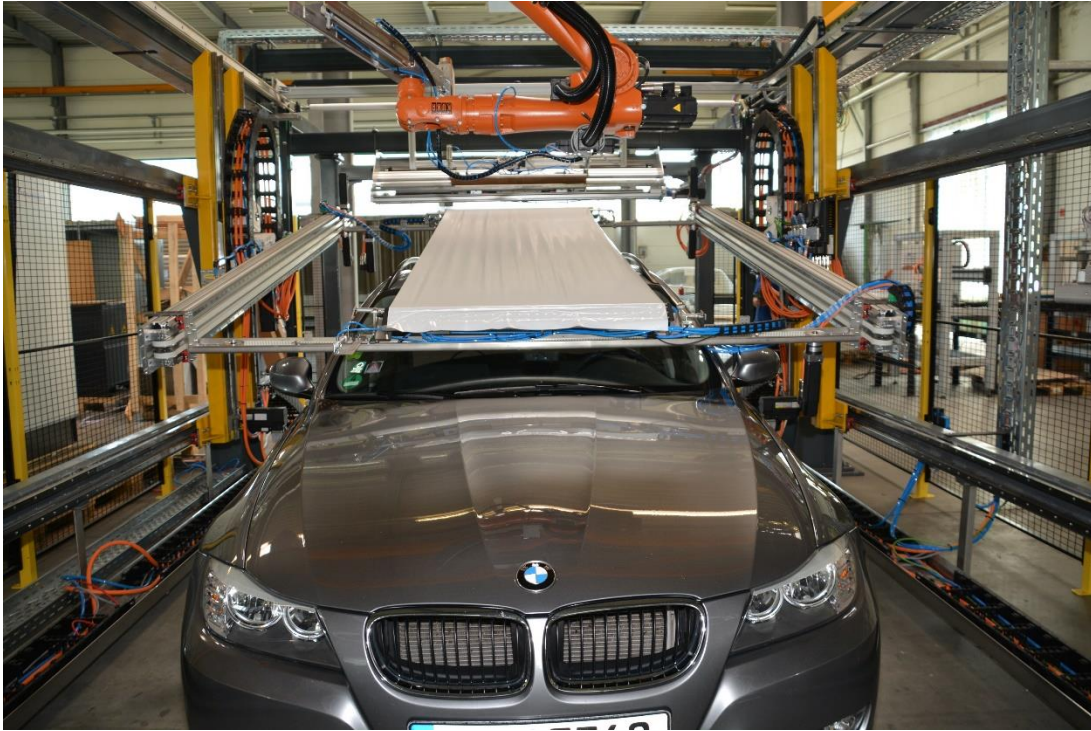
Mit der Pilotanlage von Foilpuller lassen sich Schutzfolien automatisiert auf Karosserien aufbringen.